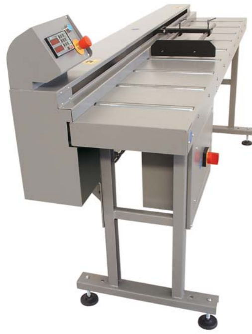
Serie RTA - Series RTA