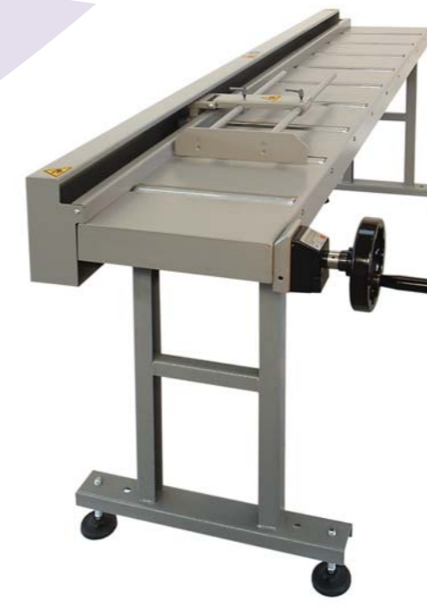
Serie RTM - Series RTM

Chassis made of steel sheet (5 mm. thickness), painted ; made of standardized units which can be assembled in different ways ; articulated and adjustable feet with the possibility of fixing of the ground ; manual position of the mechanical plate of measurement, by means of toothed belt (play zero), movement by means of handwheel ; manual mechanical stop lever. Digital display ( battery one year).