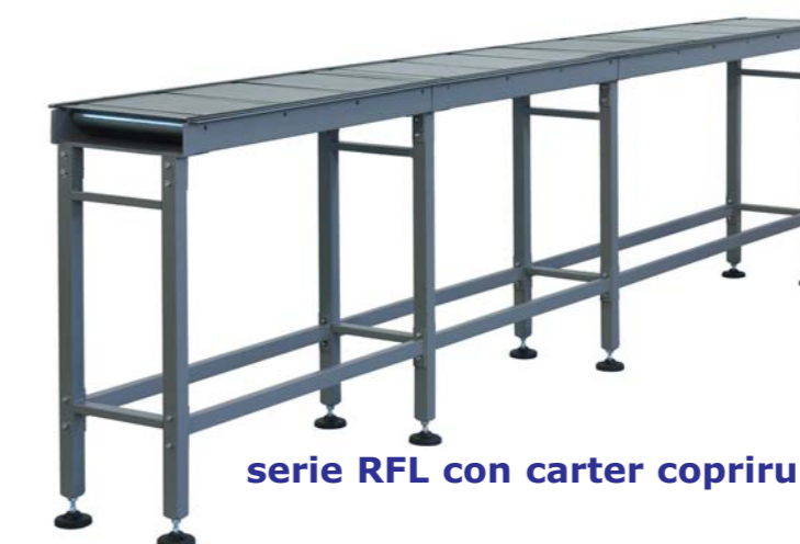
serie RFL con carter coprirulli